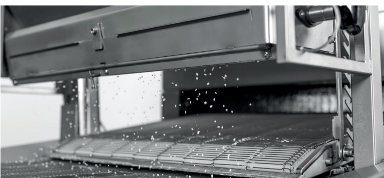
Optional: Salzer mit Wechselbehälter