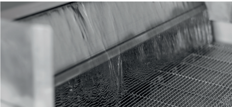
Patentierte Laugendusche + zweifacher Laugenvorhang